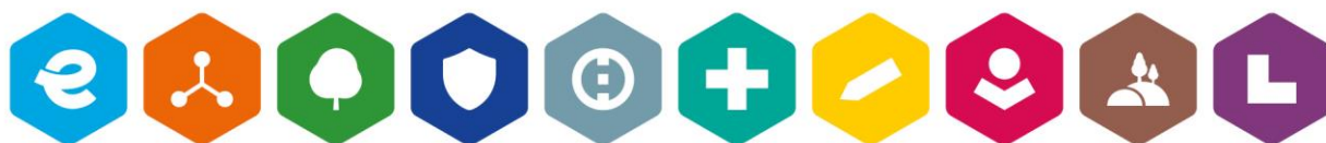
Obrázek č. 3: Letáky pro žadatele s tématy IROP